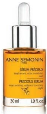
Neguje i revitalizira

Intenzivan noćni eliksir bogat eteričnim uljima za intenzivno hranjenje i regeneraciju umorne, beživotne kože.