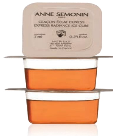
Za smanjenje pora i postizanje blistavog tena

Za trenutno blistav ten, garantovano glatku kožu, učvršćivanje kože i vraćanje sjaja u roku od nekoliko minuta.