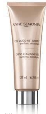
OLIGO CLEANSING GEL 125ML