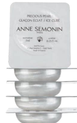
Učvršćivanje i posvetljivanje starijih pega

Trenutno podiže kožu koja je bez sjaja ili devitalizovana. Vidljivo smanjuje pore, hidrira, remineralizuje i posvetljuje kožu, čineći je ispunjenijom i prirodno podignutom.