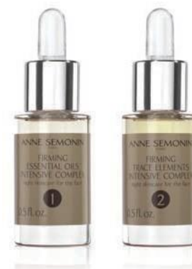
Toniranje i podmlađivanje

Tretman koji revitalizuje i jača kožu, odlaže znakove starenja i poboljšava elastičnost kože dajući joj osećaj čvrstine i potpune nahranjenosti.