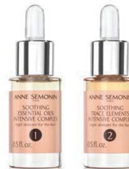
Umiruje i hidrira

Nežno obnavljajući i umirujući tretman koji brzo smanjuje iritaciju i crvenilo. Vraća prokrvljenost kože i daje joj odmoran izgled.